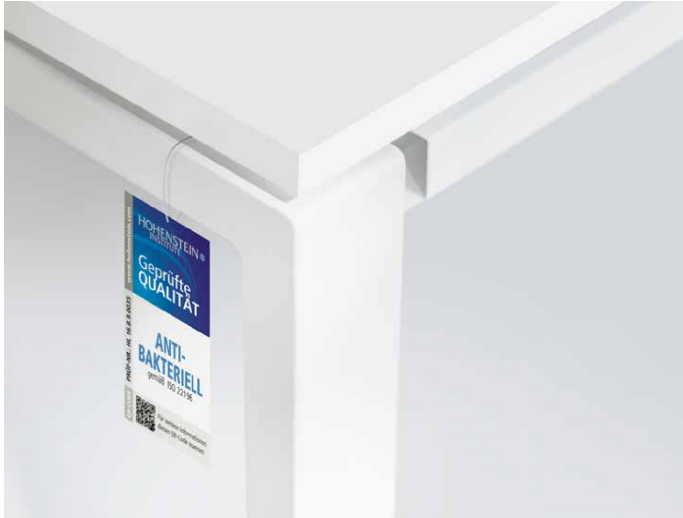
Horizontaler Kabelkanal, klappbar