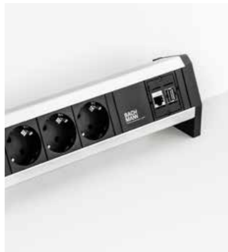
Steckdosenleiste in unterschiedlichen Ausführungen